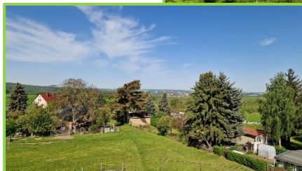
Aussicht aus der Küche